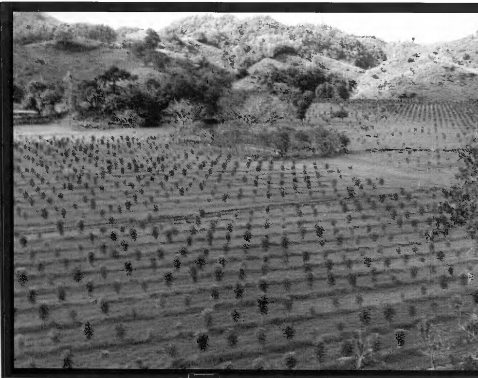
PLANTACIÓN DE CAOBA HONDUREÑA, BATERO, COTUÍ