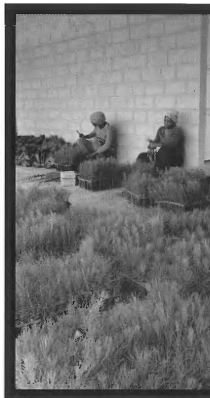
PREPARANDO PLÁNTULAS DE PINUS OCCIDENTALIS PARA LA SIEMBRA