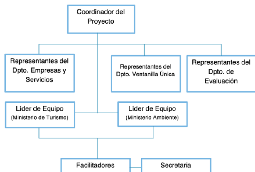
Figura No. 2. Organigrama del Comité de Implementación del Plan de Regularización.

El Comité de Implementación del Plan de Regularización estará conformado por profesio-