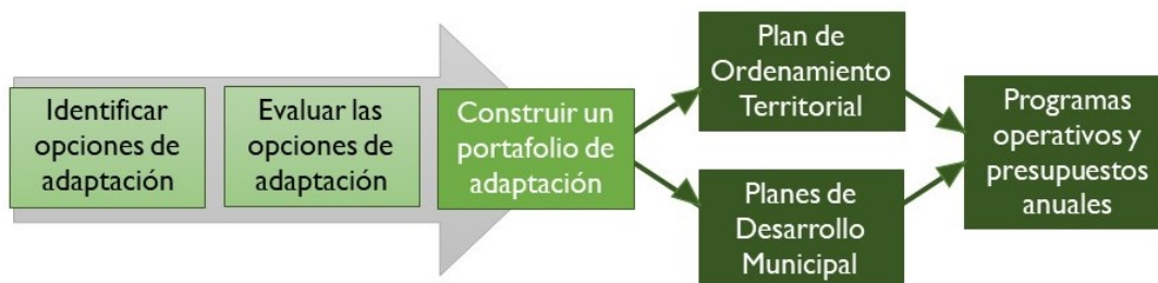
Figura 1. Vías para la implementación del portafolio de adaptación.