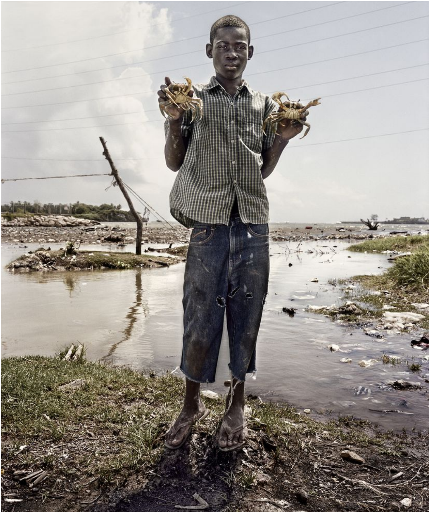
7. Un joven con cangrejos, en la desembocadura del río Aguas Negras, en Puerto Plata.