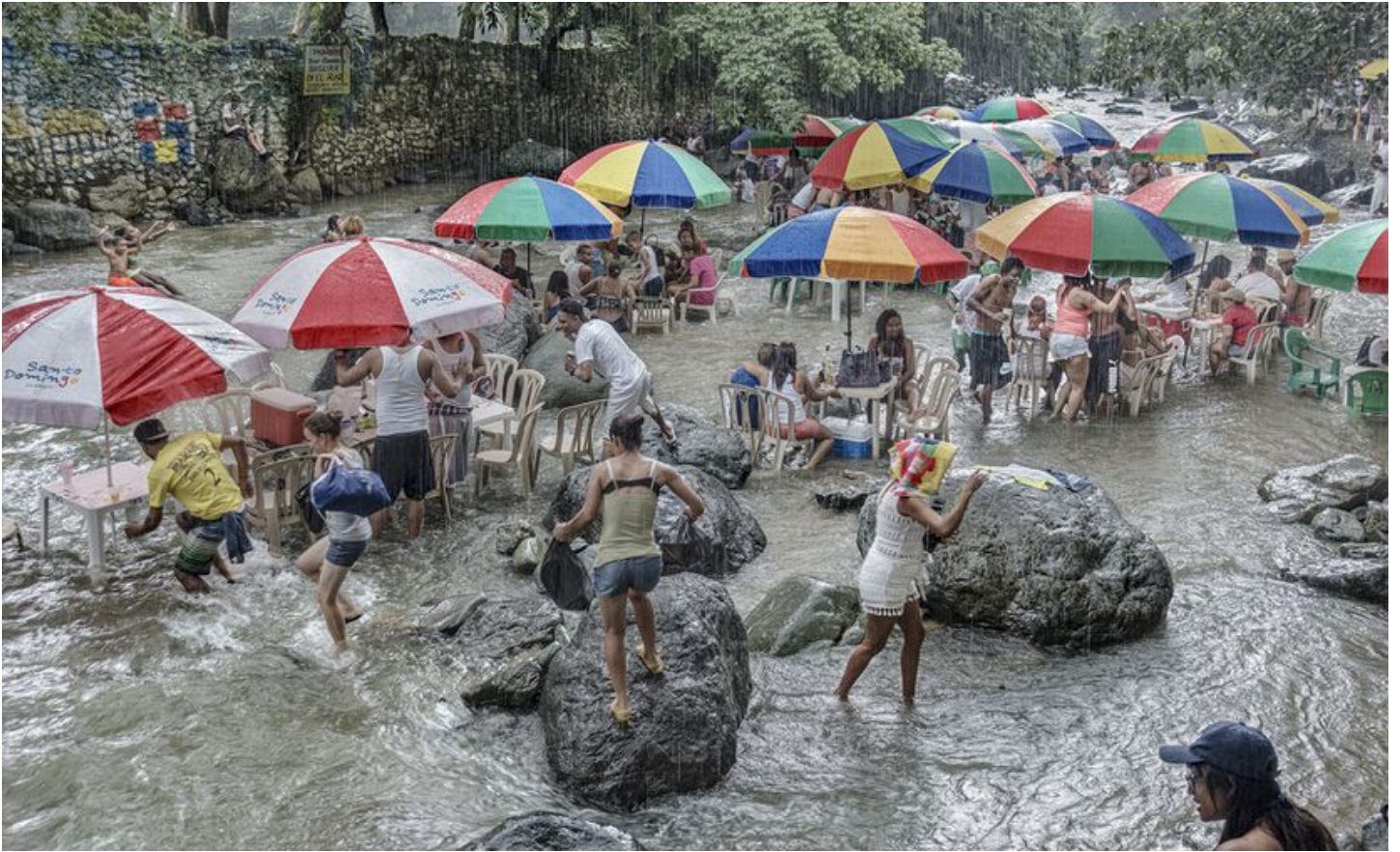
4. Familias en el balneario El Manantial del río Fula, en Bonaó, durante un aguacero.