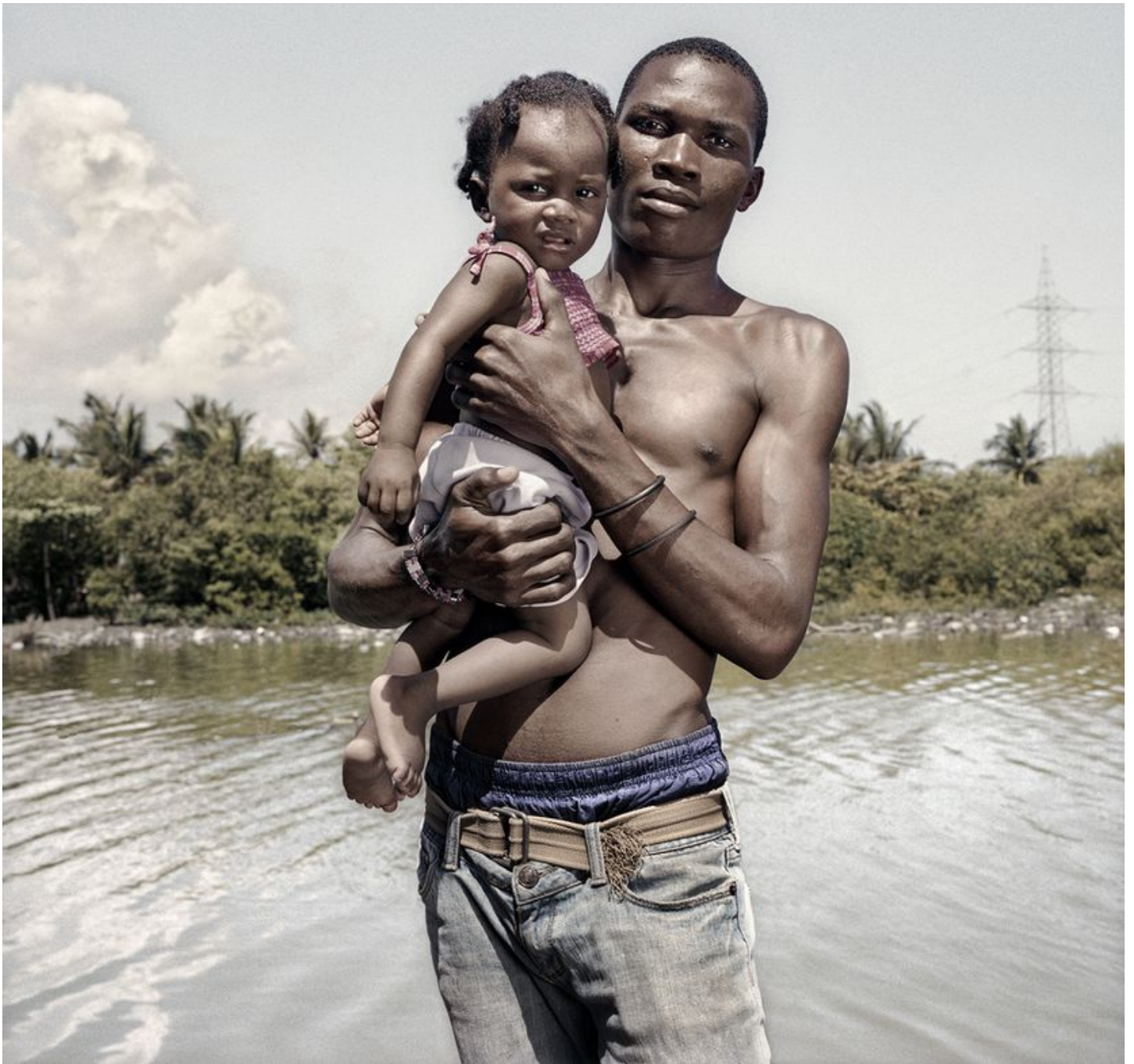
5. Un padre y su hija, en el río San Marcos, en Puerto Plata.