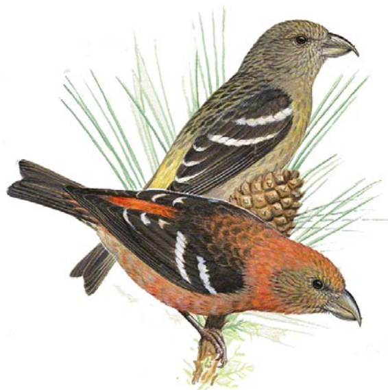
El Pico Cruzado ( Loxia megaplaga ) nuestra ave endémica recién designada a partir de los estudios realizados, ha sido nuestra ave símbolo para el festival de este año 2004