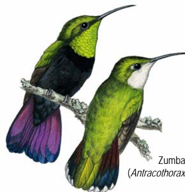
Zumbador Grande ( Antracothorax dominicus )