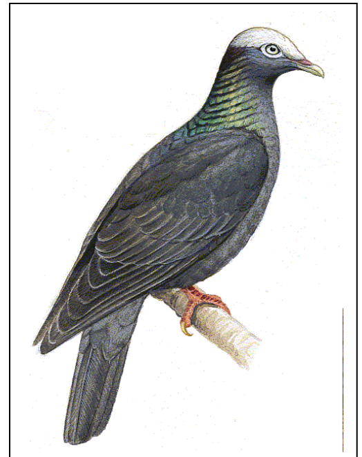
Paloma Coronita ( Columba leucocephala ), especie amenazada en el Caribe cuyas colonias habitan en la Bahía de las Calderas del Parque Nacional del Este. Éste lugar quedaría fuera de protección con la nueva Ley Sectorial de Áreas Protegidas.