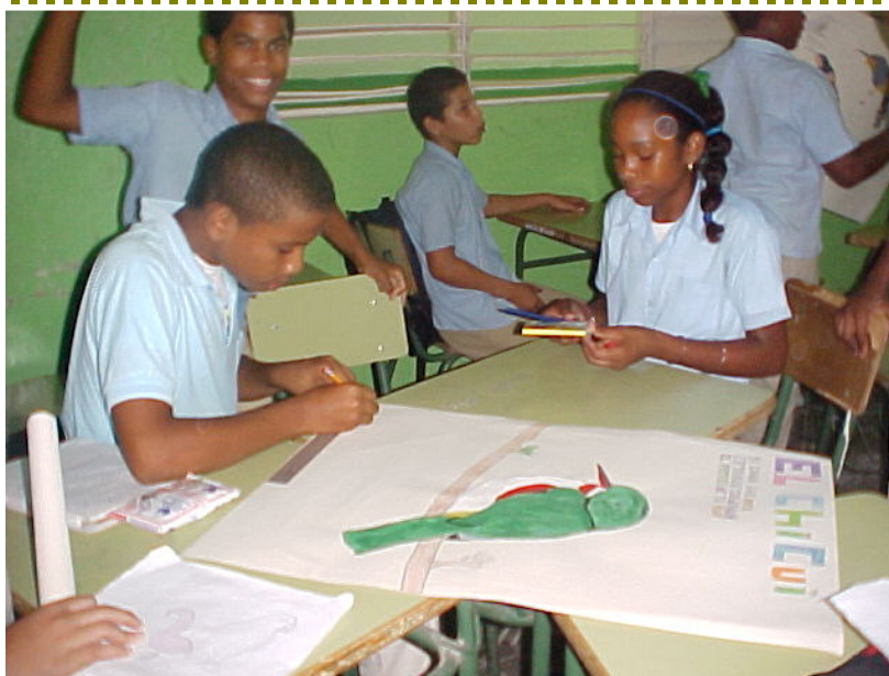
Niños elaborando un afiche para el Concurso Nacional de Afiches "Nuestras Aves Endémicas"

"La difusión abarcó planes de clases para 6,000 profesores y 180,000 estudiantes"