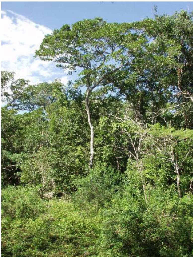
Fondo Paradí. Sitio de Importancia para las Aves en la Provincia Pedernales.

En Jaragua se han identificado 12 tipos de asociaciones vegetales. Una de la mas relevante se encuentra en "Bosque Seco de Oviedo", solamente representada en el noreste del parque y su contigua zona de amortiguamiento. Este tipo de bosque alberga la mayoría de las aves endémicas de la Hispaniola, con poblaciones numerosas y a otras especies nativas y migratorias. Es refugio de diversas especies únicas en el mundo, como lagartos, culebras dormilonas y solenodón.