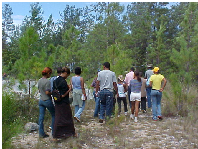
Caminata de apreciación de aves en la Reserva de Biosfera Jaragua-Enriquillo.