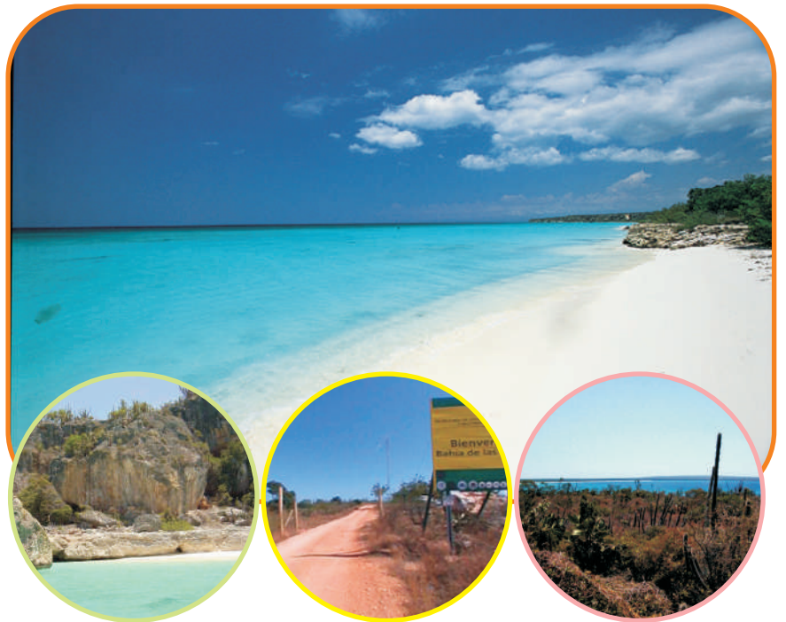
Bahía de las Águilas, Pedernales, R.D.

Fruto de esas preocupaciones y con los datos de esa investigación, contando con la asesoría de técnicos nacionales y extranjeros,